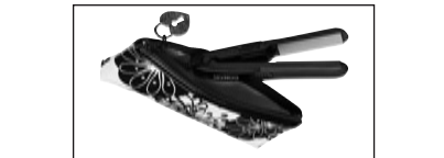
Estuche a prueba de calor que permite guardar el aparato inmediatamente después de usarlo.