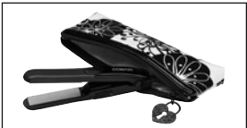
Designer storage pouch with heat resistant inner lining allows hot iron to be stored immediately after use.