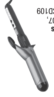
Curling Irons Models CD107, CD108 and CD109