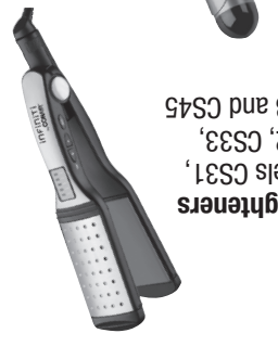
Straighteners Models CS31, CS32, CS33, CS43 and CS45