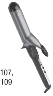
Tenacillas Modelos CD107, CD108 y CD109