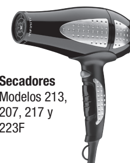
Secadores Modelos 213, 207, 217 y 223F