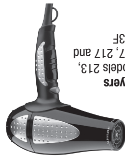
Dryers Models 213, 207, 217 and 223F