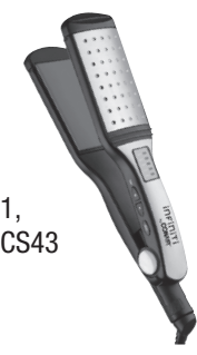
Planchas Alaciadoras Modelos CS31, CS32, CS33, CS43 y CS45