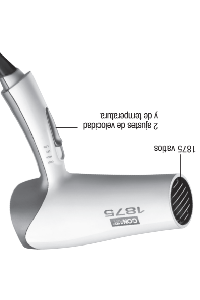
CONOZCA SU SECADOR

132. Los accesorios pueden calentarse durante el uso. Déjlos enfriar antes de manipularlos.