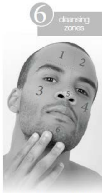
NOTE: USE FOR 10 SECONDS AT EACH LOCATION

To attach, hold the brush by the rim and attach over mounting post until it firmly snaps into place. To remove, hold the rim and pull brush off.