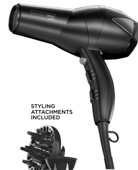
STYLING ATTACHMENTS INCLUDED

Please register this product at www.conair.com/registration