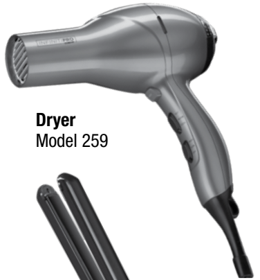
Dryer Model 259