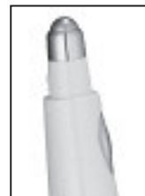
ENHANCED EYE MASSAGER