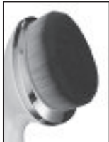
CEPILLO DE MAQUILLAJE