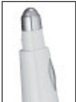
MASAJEADOR DE OJOS ANTIBOLSAS