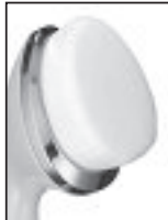
CEPILLO DE LIMPIEZA

NOTA: puede que su sistema de limpieza facial 3 en 1 True Glow® no incluya todos los accesorios disponibles. Para conseguir piezas adicionales o de repuesto, comuníquese con su detallista, llame al 1-800-3-CONAIR o visite www.trueglowbyconair.com